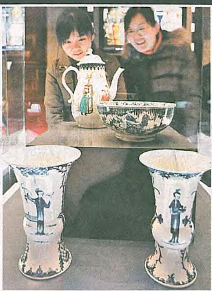
前排的兩個花瓶，是英工廠仿中國青花製造的瓷器。