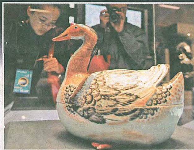
展品包括這個粉彩鵝形戴蓋湯盤，色彩豐富。