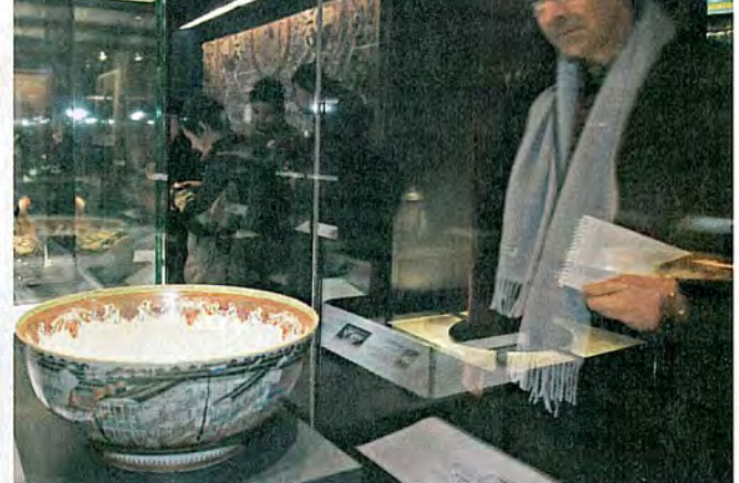
造工極為精緻的大碗，吸引參觀者專注研究。

大英博物館在北京故宮博物院的首次展覽正式揭幕，其中不少展品，更是流落在外的珍貴中國文物。以保護中國文化為己任的何東家族成員——何鴻毅家族基金主席何鴻毅，作為這次展覽贊助人亦隨實進京。談到文物外流和中國內地盜墓情況猖獗的問題，這位文化保衛者不勝欷歔之餘，亦義憤填膺，愈講愈有火！