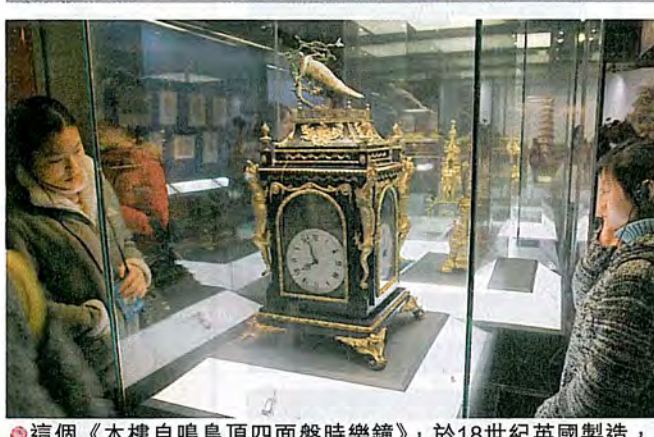
這個《木樓自鳴鳥頂四盤時鐘》，於18世紀英國製造，每逢報時鐘頂的鸚鵡會邊點頭邊鳴叫。