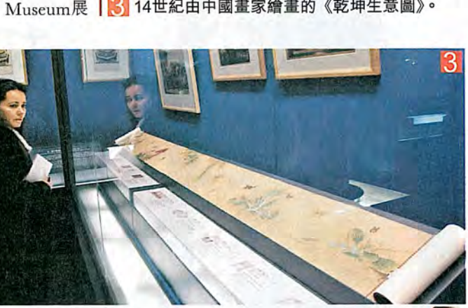
3 14世紀由中國畫家繪畫的《乾坤生意圖》。

04年在上海舉行的全球首次殷墟甲骨拍賣中，亦有神秘買家以4,800萬人民幣購入20片天津孟氏舊藏殷墟甲骨，後來該名買家更表示會將這些甲骨帶回河南安陽，供博物館研究及展覽。