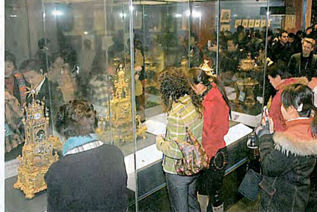
展覽會吸引大批市民參觀，對稀奇古怪趣味盎然。