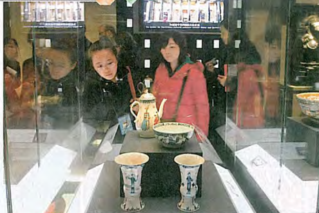
《青花仕女花瓶》於1760年英格蘭製造。