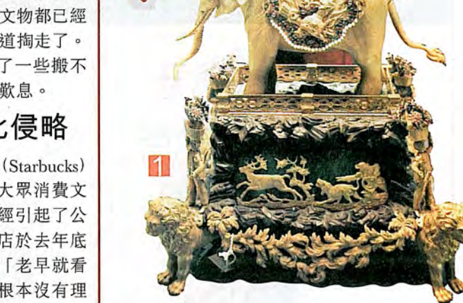
1 瑰麗精緻的銅鍍金象馱水法表。