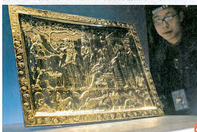
4 今次展覽中價值最高的4世紀柯布里斯奇銀盤，價值1,372萬美元。

現年74歲的何鴻毅是香港第一代富豪何東的孫兒，國民黨將軍何世禮之子。這位名門之後自幼已跟文化藝術結緣，小時候已開始接觸中國藝術作品，對中國書法及國畫尤其偏愛。長大後曾在美國新聞界工作，任職駐聯合國記者。62年回港發展後，何鴻毅仍然從事新聞行業，曾任《工商日報》社長。退休後，何鴻毅秉承了何東家族以慈善方式貢獻社會的傳統，致力推廣文化保育及藝術教育。04年，曾與本港4大家族集資5億發展極具歷史價值的中國警署建築群，可惜方案不獲政府採納。然而何鴻毅並未因而氣餒，05年，他撥款8億成立「何鴻毅家族基金」，銳意推廣文化藝術。06年，更成立「何鴻毅獎學金」以培養文化藝術界人才。