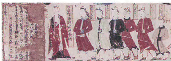
《敦煌莫高窟：中國絲綢之路上的佛教藝術》，讓觀眾大開眼界。