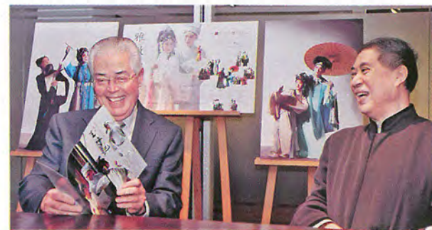
何鴻毅家族基金曾贊助白先勇(右)舉辦崑曲巡迴展。