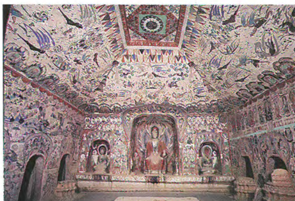
《敦煌莫高窟：中國絲綢之路上的佛教藝術》展品珍罕，亦有三個實物原大的敦煌石窟複製品。