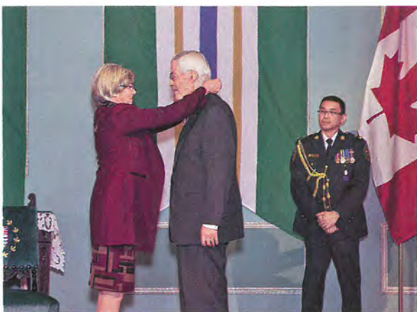
獲加拿大英屬哥倫比亞省頒授O.B.C.勳章。